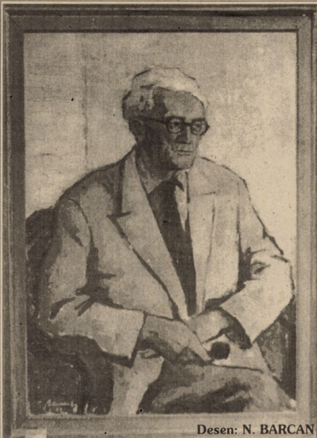
Desen: N. BARCAN

Personajele schițelor sale umoristice - în marea lor majoritate mici slujbași din târgurile de provincie: funcționari, dascăli, militari, meseriași ori negustori - constituiau o lume pe care Paul Constant o cunoștea bine, spre ea îndreptându-și scriitorul atenția și - într-un fel - compasiunea. Căci, trebuie remarcat că, zugrăvind-o cu toate slăbiciunile și limitele ei, Paul Constant n-o biciuia, ci o dojenea. Scrisul său - în volumele umoristice întruchipa poate cel mai bine acea maximă atribuită unui scriitor francez (J. Santeul): "câștigat ridendo mores" (râzând îndreptăm moravurile). De aceea poate chiar și observațiile sale glumețe la adresa unuia sau altuia - deși incisive - erau întâmpinate chiar și de către cei vizați cu o rușinată aprobare, fiindcă în gluma, în săgeata trimisă, nu era răutate, nu era otrăvă. Paul Constant nu putea fi răutăcios sau meschin.