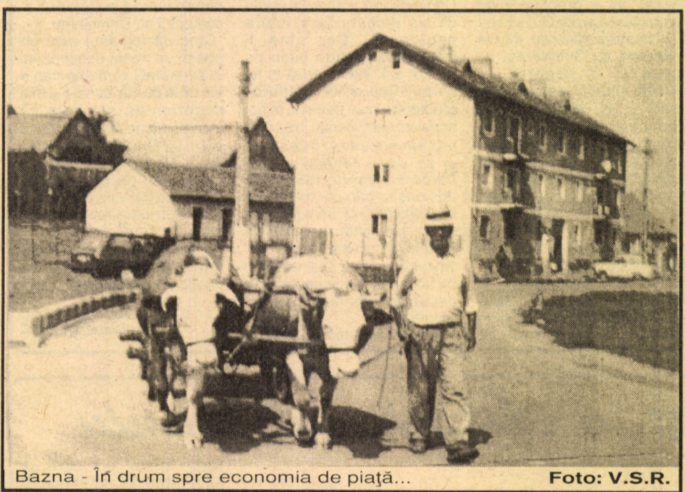
Bazna - În drum spre economia de piață...