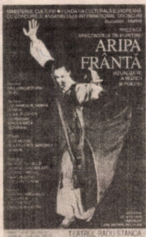
Inițiativa Waldorf Sibiu

Arta euritmica este o materie care se predă la școlile Waldorf, fiind un factor de armonizare a dezvoltării fizice și psihice a copiilor. Sub egida Ministerului Culturii, Fundația Culturală Europeană, cu concursul ansamblului internațional "Trioscursi" organizează, la Sibiu, un spectacol de euritmie, intitulat "Aripa frântă". Spectacolul va avea loc marți, 11 iunie a.c., ora 19, în sala teatrului "Radu Stanca". Accesul la acest spectacol este permis tinerilor care au împlinit 14 ani. A doua zi, miercuri, 12 iunie, ora 12, se va oferi un spectacol pentru copii, la care intrarea va fi liberă.