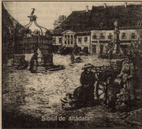
Sibiul de altădată