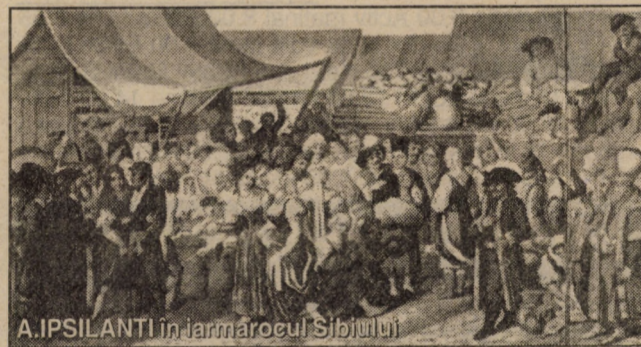
A. IPSILANTI în iarmarocul Sibiului