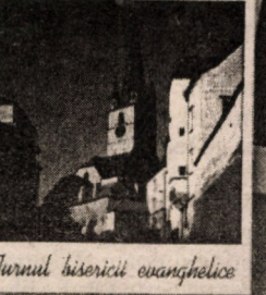
Turnul bisericii evanghelice