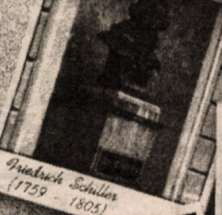
Friedrich Schiller (1759 - 1805)