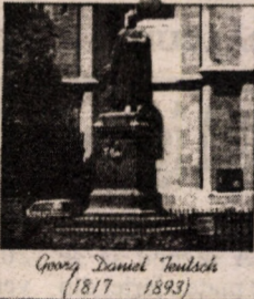
Georg Daniel Teutsch (1817 - 1893)