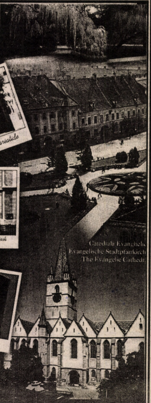
Catedrala Evanghelică Evangelische Stadtpfarrkirche The Evangelic Cathedral