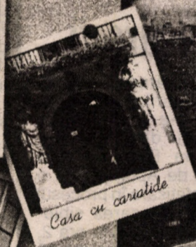
Casa cu cariatide