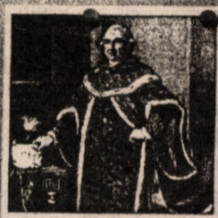
Baronul Samuel von Brukenhith