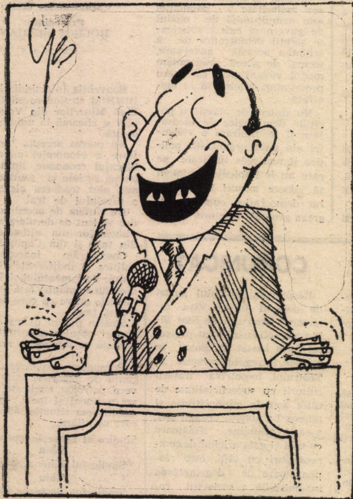
ULTIMUL ZIMBET SINISTRU

Regii sau kedivii Egiptului și-au format o armată din copiii luați cu sila de la populațiile supuse din jur, formînd astfel armata mamelucilor, armată care n-a fost înfrîntă trei secole, pînă cînd a venit cu oastea numitul Napoleon Bonaparte, care a desființat prin luptă acea neînvingătoare — pînă atunci — oștire, lîngă piramidele egiptene.