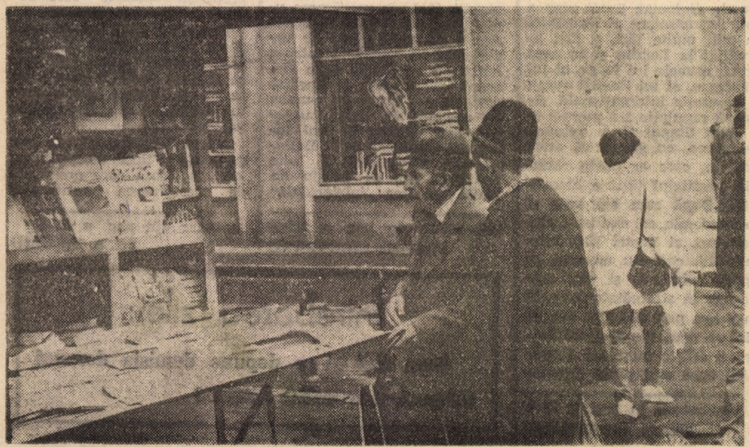
În căutarea adevărului... pierdut.