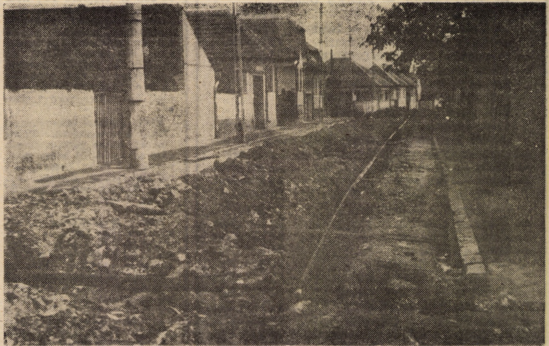
În Turnișor — lucrări de gaz metan începute și lăsate baltă.