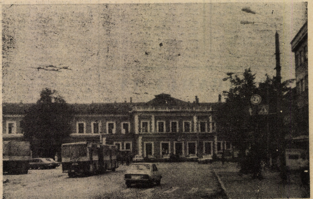
Bătrîna Gară din Sibiu, în așteptarea modernizării.