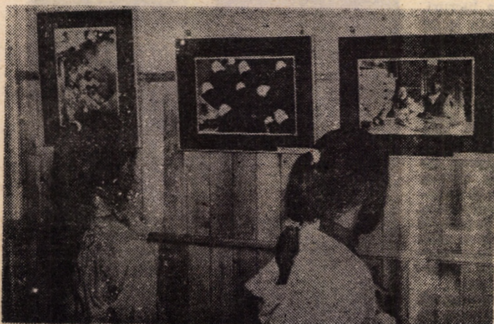
În cadrul Muzeului de Istorie din clădirea vechii primării sînt încă deschise expozițiile...