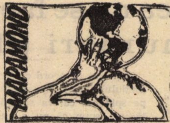
INCERTITUDINE — VUKOVAR — 14.10. Mii de oameni au murit în războiul din Croa-

ția, de peste 3 luni, dar cei mai mulți soldați iugoslavi au murit în primele 3 zile de la începerea armistițiului, declara eu amar un general. Ritualul conferințelor de la Haga a continuat și luni, avîndu-l protagonist pe americanul Cyrus Vance, care a expus primele sale concluzii, înainte de a le prezenta secretarului general ONU, al cărui trimis personal este. Comunitatea Europeană care nu e dispusă să recunoască schimbarea granițelor prin forță, îl va asculta pe 18 octombrie și pe Stipe Mesici „președintele legitim al fostei Iugoslavii”, după propria-i expresie.