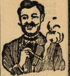
Pastilele lui Egger mă scăpară iute.