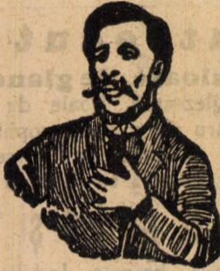
Afurisita de tusa mă înneacă

La tusa, răgușală și întrocenare ajută sigur și repede